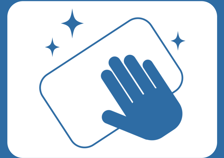
定期的な清掃・消毒