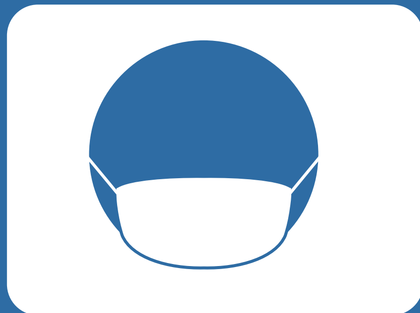
マスクの着用を お願いします