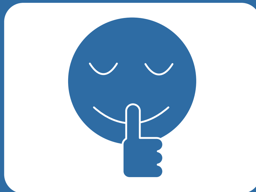
会話を控えるよう お願いします