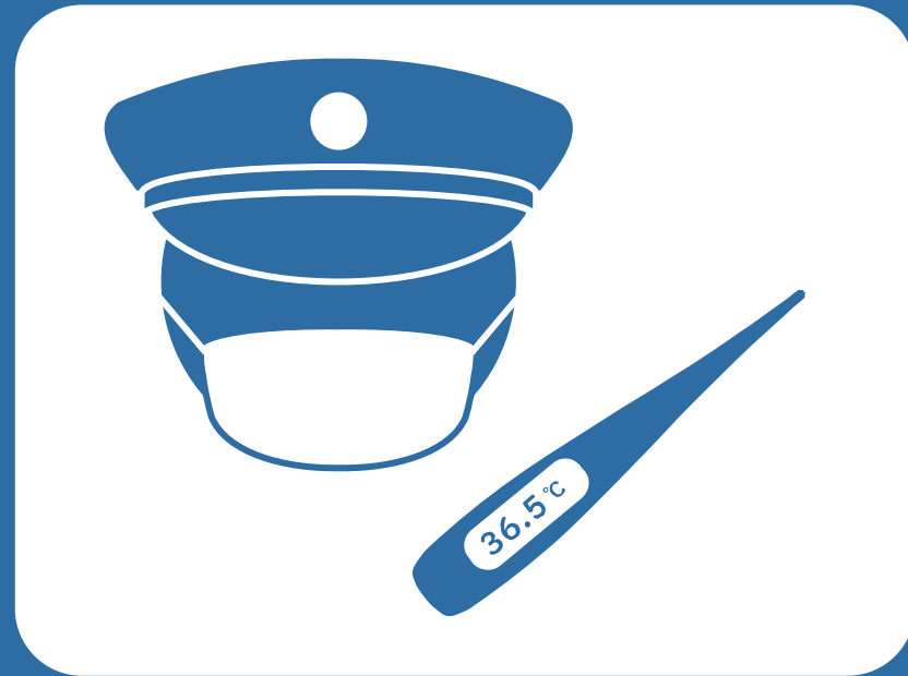
マスクの着用・健康管理