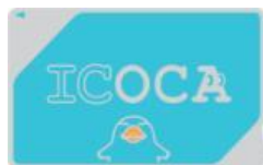
<バス ICOCA 定期券内容控>