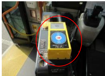
【降車時のICカードリーダー】