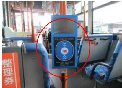
【乗車時のICカードリーダー】